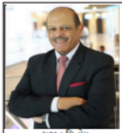
-સુજન ચિનોય ડિરેક્ટર જનરલ, મનોહર પરિકર ઈન્ટિલિજન્ટ ફોર ડિફેન્સ સ્ટ્રીટ એન્ડ એનાલિસિસ

વ્રજકિશન ભૂમિ નિર્ધારિત યુદ્ધની વ્યૂહરચના પાકિસ્તાન સમર્થિત આતંકવાદીઓએ ગત ૨૨ એપ્રિલના રોજ, કાશ્મીરના પોલવામમાં મોટી સંખ્યામાં નિર્દોષ પ્રવાસીઓની નિર્દયતાથી હત્યા કરી હતી. જવાબમાં, ભારતે કાળજીપૂર્વક પસંદ કરેલા નવ લશ્ચો સામે અમુતપૂર્વક અને સચોટ લશ્કરી કાર્યવાહી શરૂ કરી હતી. આ કાર્યવાહીમાં ભારતીય ભૂમિ પર હુમલા કરવા માટે ઉપયોગમાં લેવાતા મુખ્ય આતંકવાદી માળખાનો સંપૂર્ણપણે નષ્ટ કરી દેવામાં આવ્યા. ભારતે નાગરિક જાનનાશ ટાળવાનો પ્રયાસ કર્યો, પરંતુ પાકિસ્તાને નાગરિકો અને લશ્કરી સ્થાપનોને નિશાન બનાવીને પરિસ્થિતિને વધુ ખરાબ કરી હતી. આ પ્રયાસો નિષ્ફળ ગયા અને ભારતે આતંકવાદી નેટવર્કને ટેકો આપતા પાકિસ્તાનમાં મુખ્ય લશ્કરી સ્થાપનો સામે સચોટ જવાબી કાર્યવાહી કરી.