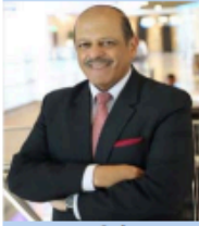
સુજાન વિનોબા ડિરેક્ટર જનરલ, મનોહર પરિંકર ઈન્સ્ટિટ્યૂટ ફોર ડિફેન્સ સ્ટ્રીટ એન્ડ એનાલિસિસ

નિર્ણયિત યુદ્ધની વ્યૂહરચના પાકિસ્તાન સમર્થિત આતંકવાદીઓએ ગત ૨૨ એપ્રિલના રોજ, કાશ્મીરના પોલોગામમાં મોટી સંખ્યામાં નિર્દોષ પ્રવાસીઓની નિર્દયતાથી હત્યા કરી હતી. જવાબમાં, ભારતે કાળજીપૂર્વક પસંદ કરેલા નવ લક્ષ્યો સામે અમૂતપૂર્વ અને સચોટ લાક્ષણિક કાર્યવાહી શરૂ કરી હતી. આ કાર્યવાહીમાં ભારતીય ભૂમિ પર હુમલા કરવા માટે ઉપયોગમાં લેવાતા મુખ્ય આતંકવાદી માળખાનો સંપૂર્ણપણે નષ્ટ કરી દેવામાં આવ્યા. ભારતે નાગરિક જનતાનિ રાજવાનો પ્રયાસ કર્યો, પરંતુ પાકિસ્તાને નાગરિકો અને લાક્ષણિક સ્થાપનોને નિશાન બનાવીને પરિસ્થિતિને વધુ ખરાબ કરી હતી. આ પ્રયાસો નિષ્ફળ ગયા અને ભારતે આતંકવાદી નેટવર્કને ટેકો આપતા પાકિસ્તાનમાં મુખ્ય લાક્ષણિક સ્થાપનો સામે સચોટ જવાબી કાર્યવાહી કરી.